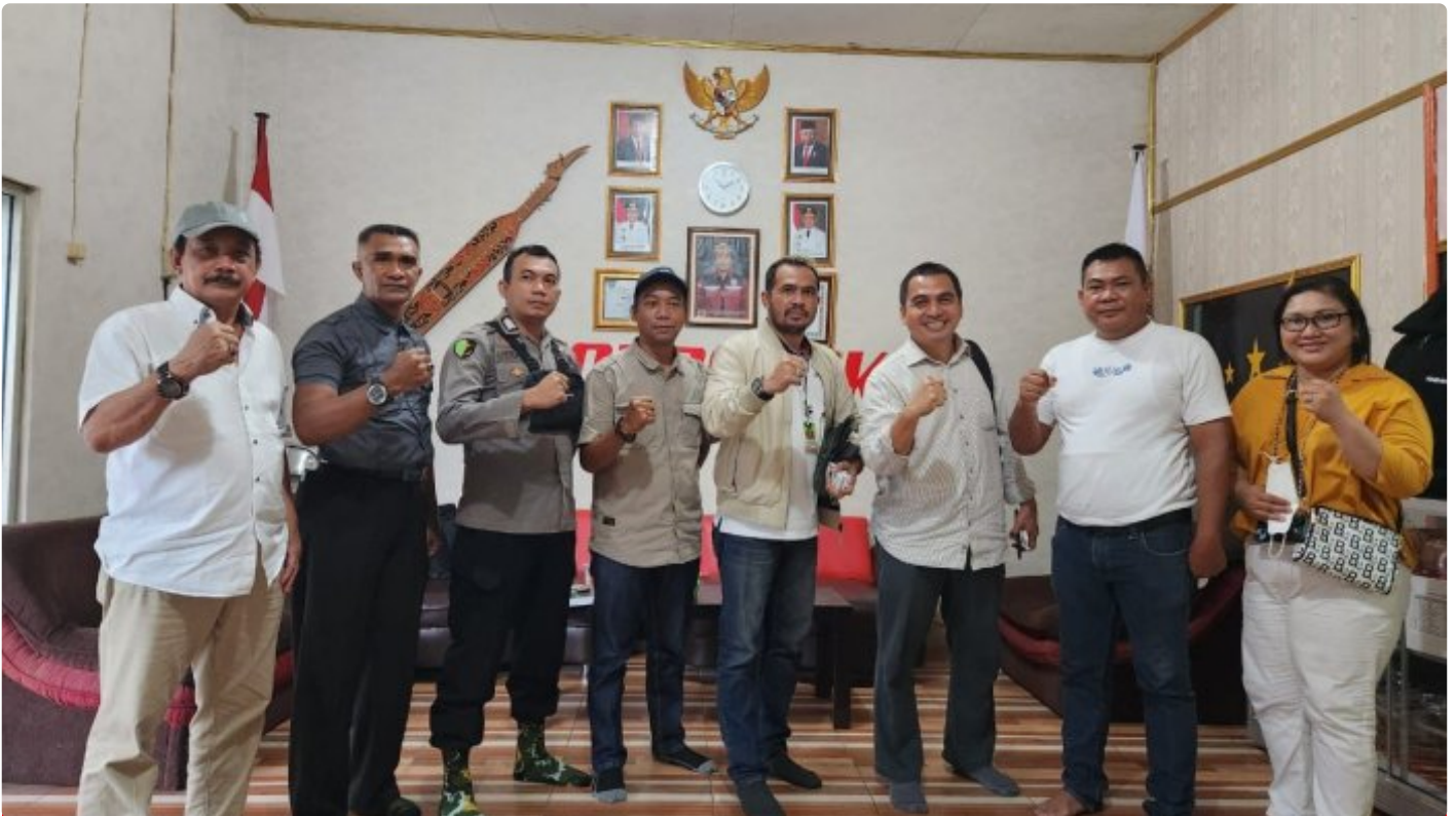
Tim PT Agasa Kalimantan Tengah

PALANGKA RAYA - PT Agasa Kalimantan Tengah (PT Agasa Kalteng) merupakan Badan Usaha Jasa Pengamanan (BUJP) Perusahaan lokal Kalimantan Tengah yang bergerak di bidang industri security, meliputi "Jasa Pelatihan Dasar SATPAM (Gada Pratama/Madya), dan Jasa Tenaga Pengamanan (Outsourcing)".